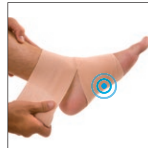
Brennt die Fußsohle?