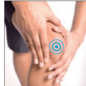
Zwackt das Knie?