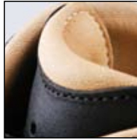
Doublure intérieure en cuir très souple