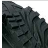
Semelle en TPU 3 phases