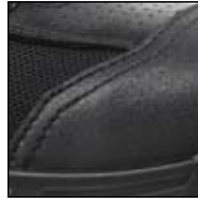
Protection de l'avant de la chaussure