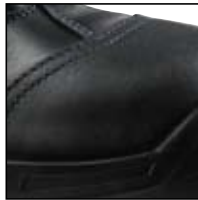
Protection de l'avant de la chaussure