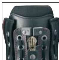
Système de laçage HAIX® -Schnürsystem