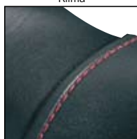
Protection de l'embout de sécurité avec encoche pour coutures

Matériau extérieur: Cuir imperméable, traité hydrophobe, respirant (5,0 mg/cm 2 /h), d'épaisseur 2,5 - 2,7 mm