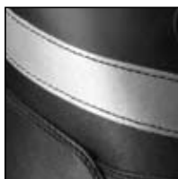
Bande rétro réfléchissante