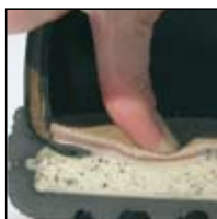
Système de mousse injectée HAIX® -MSL

Matériau extérieur: Cuir imperméable, traité hydrophobe, respirant (5,0 mg/cm 2 /h), d'épaisseur 2,5 - 2,7 mm