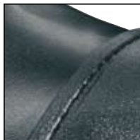
Encoches pour coutures