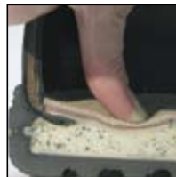
Système MSL HAIX®