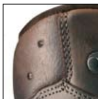
Système d'aération HAIX® -Klima