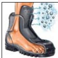
Système de languette HAIX® -CT