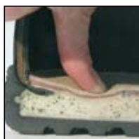
Système de mousse injectée HAIX® -MSL