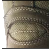
Protection du tendon