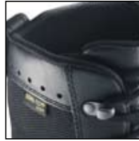
Matériau de grande qualité