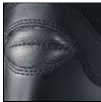
Protection du tendon