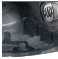
Profil de la semelle

Matériau extérieur: Une combinaison de cuir et de tissu polyamide; le cuir est imperméable, doux et souple, traité hydrophobe, respirant (5,0 mg/cm 2 /h), d'épaisseur 2,0 - 2,2 mm; le tissu est très résistant et particulièrement respirant (> 12,0mg/cm 2 /h)