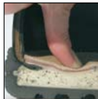
Système de mousse injectée HAIX® -MSL

Matériau extérieur: Cuir imperméable, traité hydrophobe, respirant d'épaisseur 2,0 - 2,2 mm