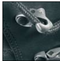
Crochets auto bloquants